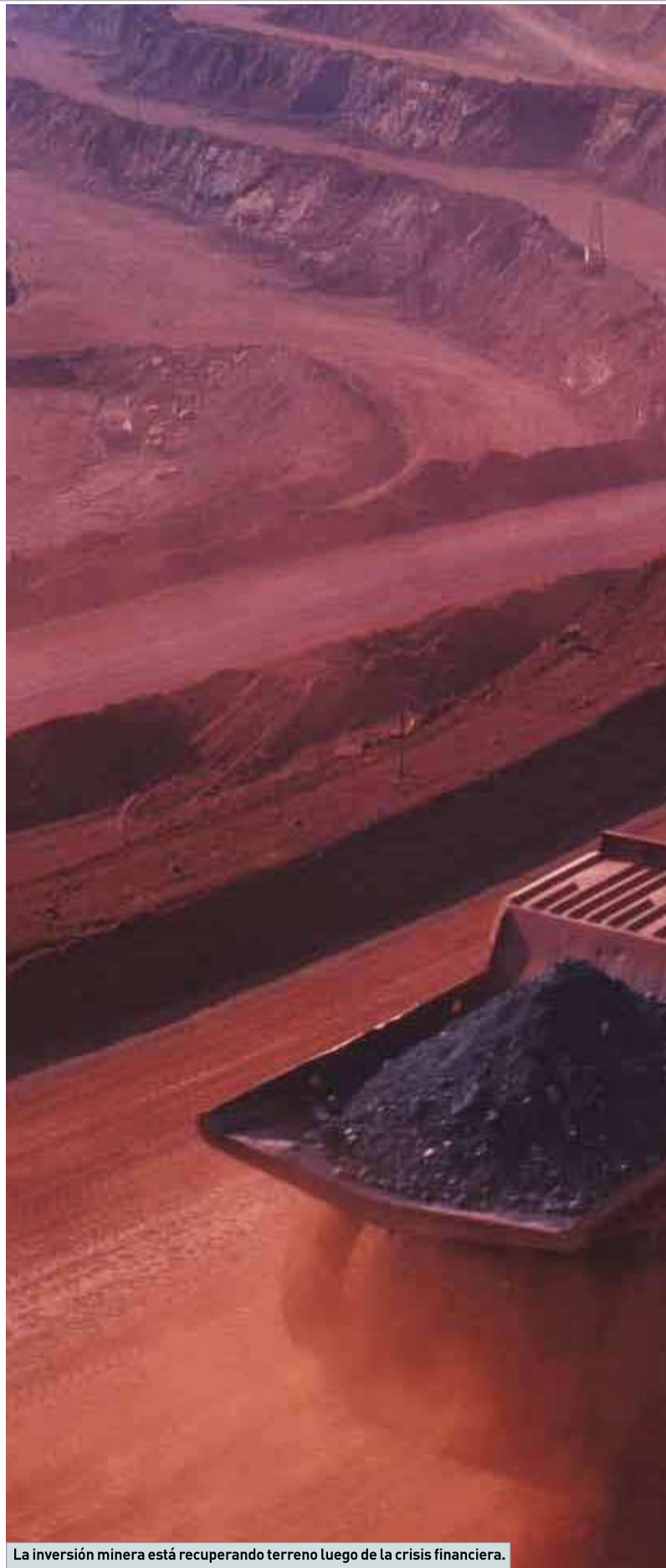
La inversión minera está recuperando terreno luego de la crisis financiera.

Es interesante ver cómo el mundo absorbe el cambio estructural en la economía mundial de que muchos millones de personas, principalmente en China, se estén incorporando al consumo y