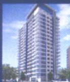
VIÑA DEL MAR