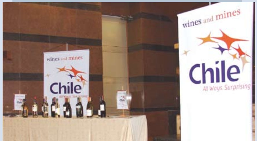
Vinos con el concepto “Wines and Mines”.

Se pretende replicar este mismo concepto en la tradicional cena anual de la Bolsa de Metales de Londres, en octubre del presente año, así como también en la reunión anual del Foro Económico Mundial en Davos en 2008.