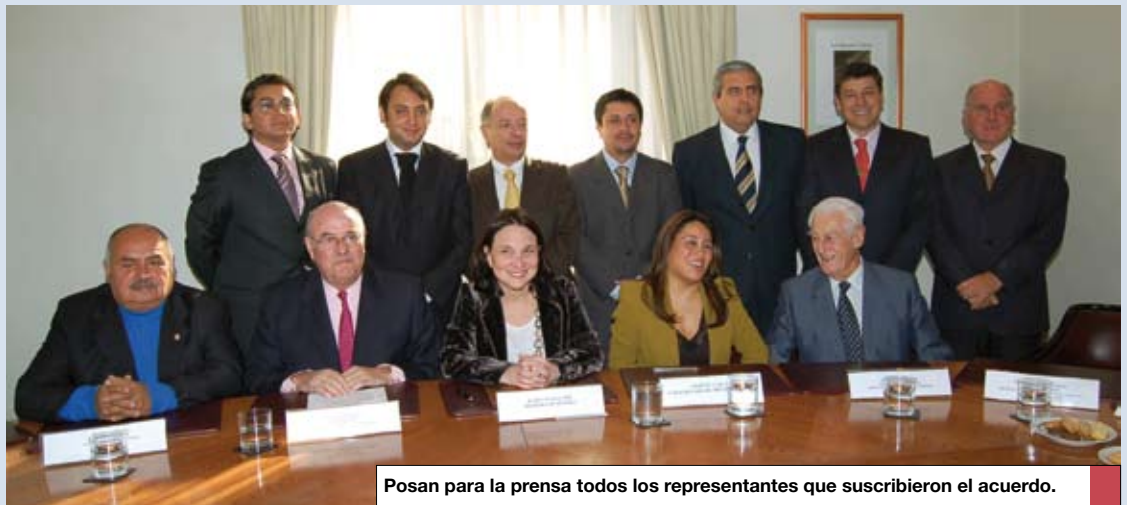
Posan para la prensa todos los representantes que suscribieron el acuerdo.

“Confiamos que estas materias serán tratadas en un futuro próximo, pues la misma Presidenta Bachelet señaló no hace mucho, que no hay temas tabú y que es necesario avanzar en la agenda laboral”, precisó el también titular de la SONAMI.