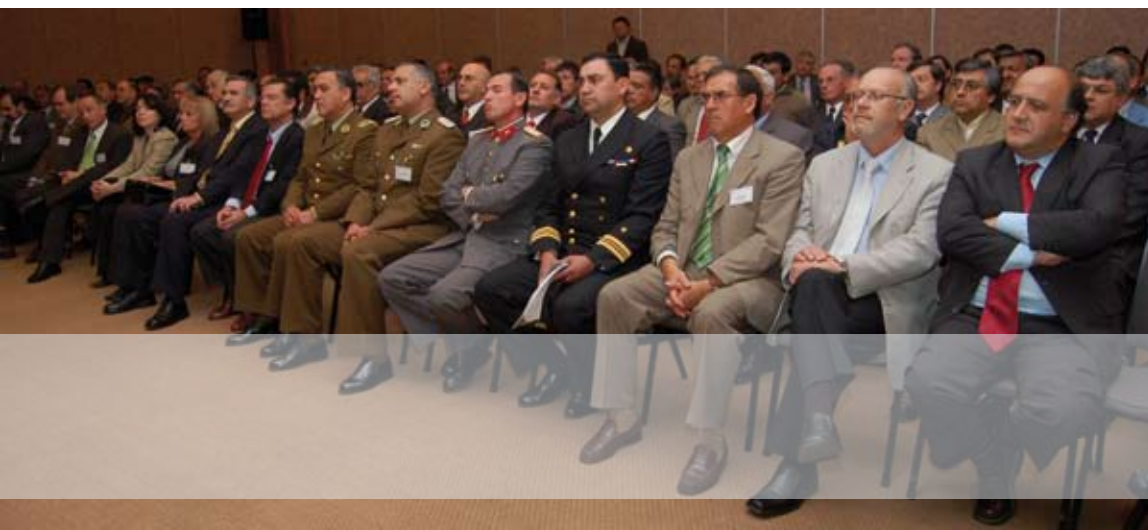
Las máximas autoridades de la región, civiles y militares, se dieron cita en la Asamblea Nacional Minera.

desafíos que tienen que ver con mayores exigencias ambientales y a los problemas generados por el alto costo de la energía y la escasa disponibilidad de agua.