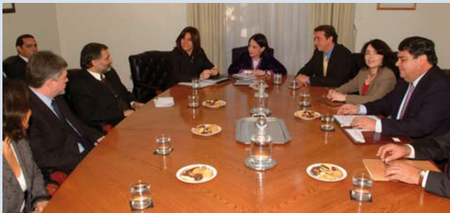
La reunión contó con la asistencia de los representantes de SONAMI y del Consejo Minero.

La denominada “Mesa del Agua” se reunirá en seis semanas más con el propósito de establecer una hoja de ruta para un trabajo conjunto público-privado sobre la materia.